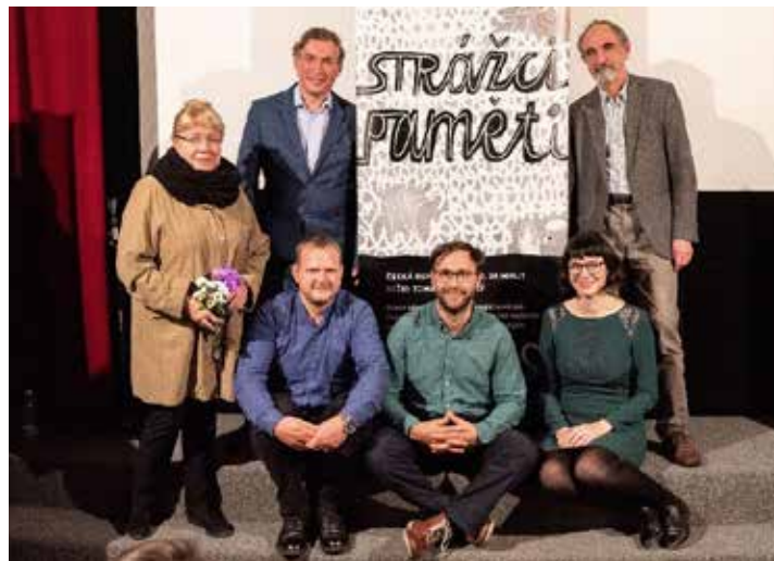
24. 10. Premiéra filmu / Praha, kino Ewald