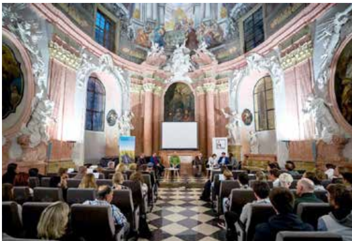
Předpremiéra filmu Strážci paměti na univerzitě Palackého v Olomouci